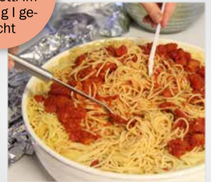
Verpflegung am Training