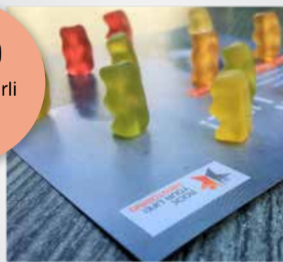
In den Strassen Luzerns