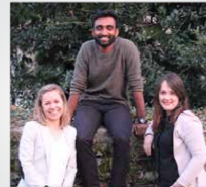
Team RYL! Luzern